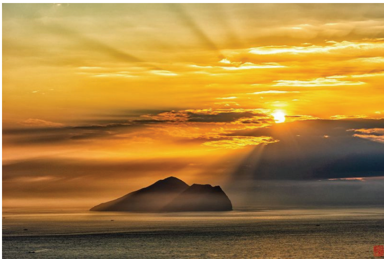
龜山旭日（頭城大修宮遠眺太平洋）