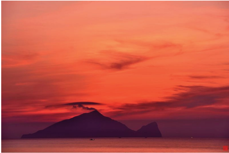
龜山朝霞（壯圍鄉永鎮海邊）