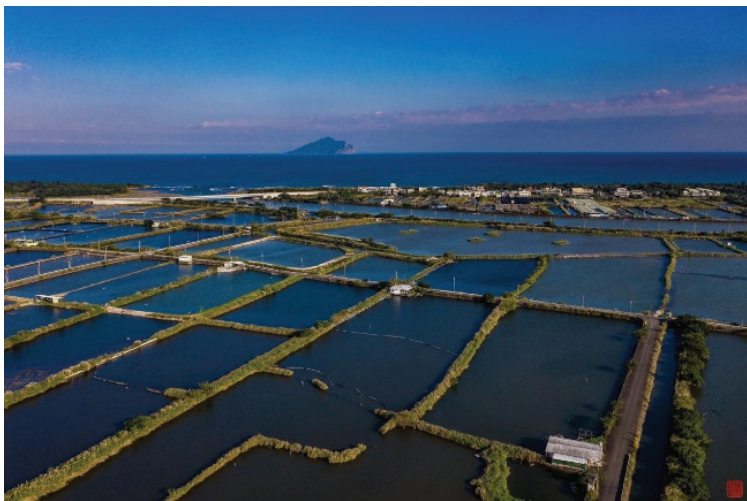
遙望龜山島（頭城下埔四十溼地空拍全景）

那麼是不是瞿牛峽口，龍首山邊，少有的珍奇山形，傳說中的灑灑堆湍急水勢也比不上？又或者在深遠無際的大海，想要如負山的海中大龜，載著蓬萊神山而行。大鯨的背脊時時掀起，最後已模糊不清，鬣魚如扇的背骨，開展未收，到底是怎麼孕育形成的？難道是此山具有美好的風土，足以在大海洪濤中產生奇異之象，長期的任由驚奇成長，在興起、止息的衝撞間，翻騰不已。以此得知其精神氣韻足以觸動北斗祥瑞，大自然並非無意於化育，星宿感應，預示著人類文明宏圖大展的徵象。