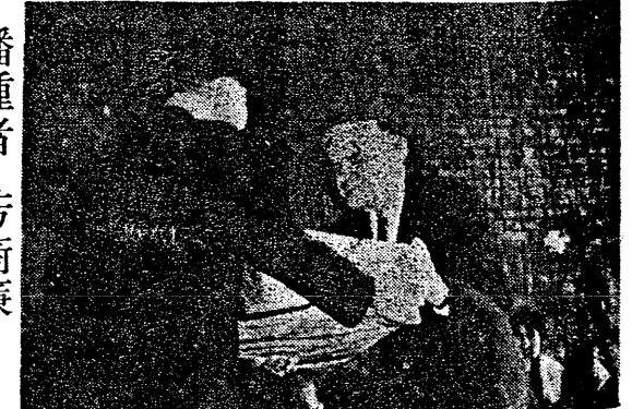
士博芳贈致冊一畫名宮故以校本表代長校吳為圖