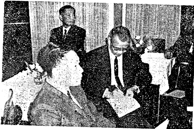
圖為陳主席與會時攝