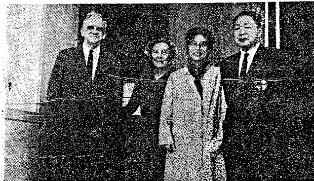
念留攝合婦夫士博芳與儷伉長校吳後會月員動為圖

解，否則，亦不過僅能作為一普通之工程人員而已。(四)我國曾獲得諾貝爾獎金之李政道博士，認為現代物理學已發展至高峯，嘗鼓勵後學研究我國易經，以啟發吾人之想像力，從而創造新的境界與理論。吳校長旋論及東海精神，略謂精神係一空洞名詞，究竟何者方能代表東海精神，一時殊難斷言，惟可舉四例以為範疇(一)本校生