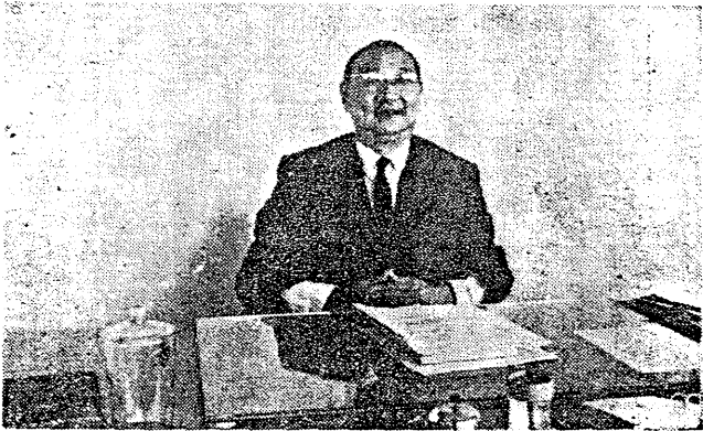
攝時室公辦在長院謝為圖

但彼認為工學院雖有建築，化工及工三系，但僅有連繫，而無面的建築及化工兩系為例，認為有建築系而無土木系，有化工系而缺機械系，即難收相輔相成之效，現因工院成立未久，當逐步求其擴充，使將來能發展為面的連繫。謝氏次認工院設備，尚待增加；而專任教授，亦待增聘，俾在教學方面，能與文理兩院，並駕齊驅；彼並就其蒞任前曾赴美考察一事