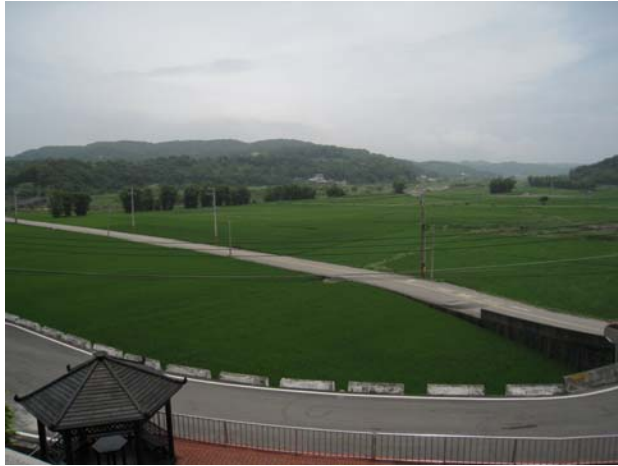
〔圖 1〕雲梯書院(宣王宮)前開闊的西湖溪河谷平原

7.潘朝陽：《臺灣儒學的傳統與現代》，台北：國立臺灣大學出版中心，2008 年。