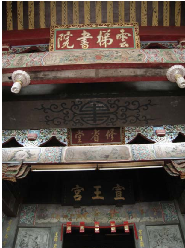
〔圖 2〕宣王宮殿前由外而內的扁額(雲梯書院、修省堂、宣王宮)