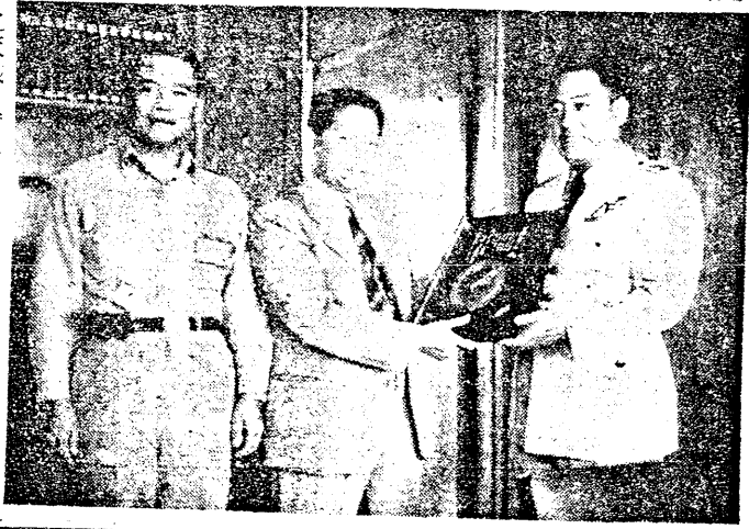
空軍聯隊受司吳校長授受徽像

【本報訊】空軍第 空軍聯隊贈徽，由校長代表接受。空軍聯隊贈徽，由校長代表接受。空軍聯隊贈徽，由校長代表接受。