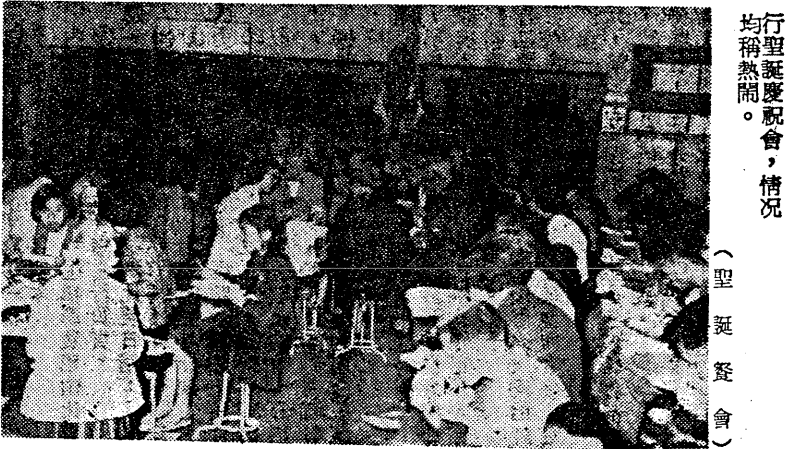
行聖誕慶祝會，情況均稱熱鬧。

【本刊訊】東海主日學及婦女會，曾於廿一廿七兩日分別舉行聖誕慶祝會，廿四日晚六時在男生膳廳舉行，參加者約共一千二百餘人，包括全校男女學生，教職員工及其眷屬，餐會開始時，由韓牧師領導禱告並合唱聖誕詩歌，在千餘人同聲高唱中，充份表現大東海之家庭精神，飯後並映幻燈影片，藉助餘興。