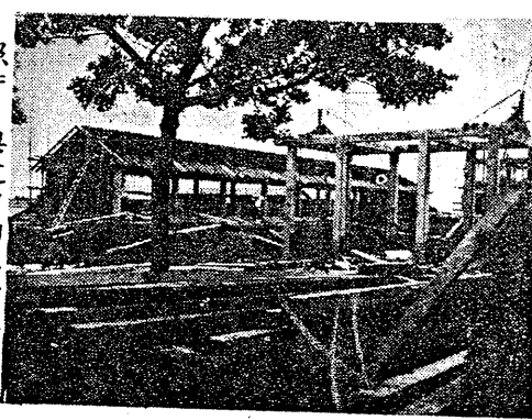
照片：興建中的工學院

【本刊訊】本校聖樂團第十次旅行演唱，自五月十日開始，至五月廿日結束，成績斐然，深獲各界一致好評。省府黃杰主席，於該團演唱完畢後，親贈「天韻歌聲」錦旗一面，並以茶會款待各團員。 【本刊訊】聖樂團於五月廿九日上午九時，在路思義堂對校內作盛大演唱，其演唱節目，為旅行演唱節目之精華，充滿教堂，洋溢，充沛教堂，使聽眾的心靈，自然交流於美妙的音響中。該團所唱的中國歌曲，尤以「中國人」一曲，更充份表現了中國人自強不息的大無畏精神，和聲共鳴，