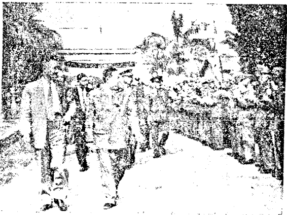
吳校長等檢閱步校儀隊