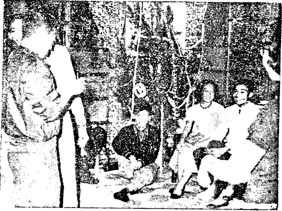
聖誕佳音隊準備出發