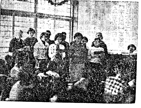
東海婦女會唱詩班