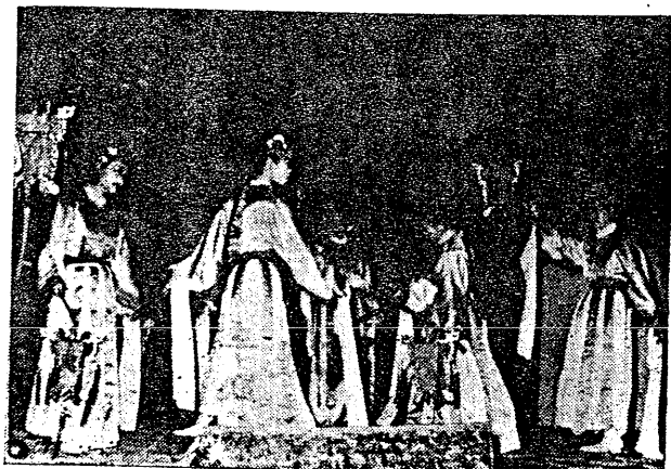
舞燈宮演表員會會友三