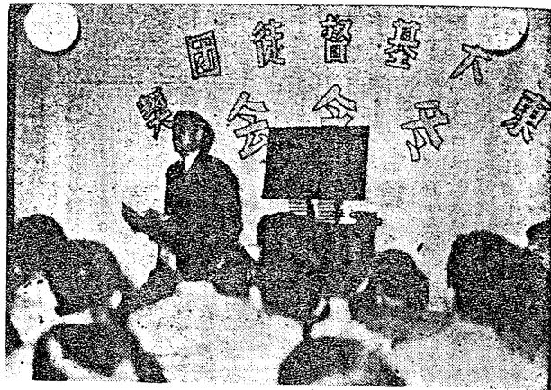
賽競驗測經聖會令冬