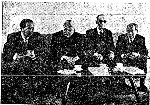
團問訪化文南越待招長務教唐