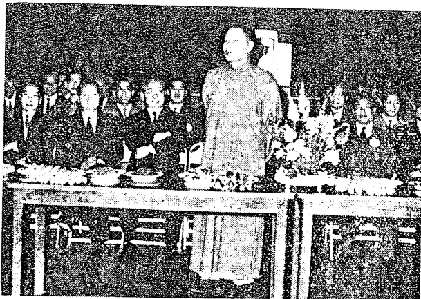
員會會友三迎歡詞致中會茶在長校吳