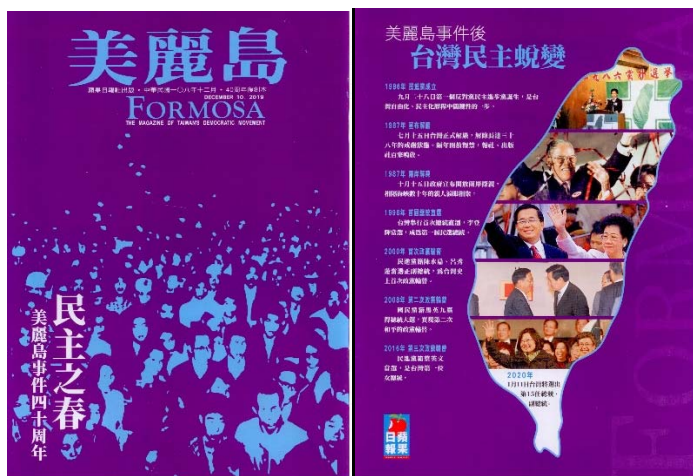
《美麗島》四十周年復刻紀念版