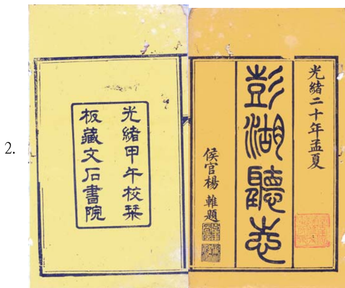
東海典藏清光緒二十年刻《澎湖廳志》