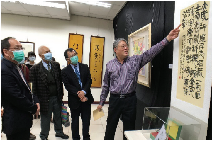
師長們參觀珍藏書畫

在創校 65 週年校慶之際，展出平日珍藏於館內秘府之處的器物書畫，希冀這些文物的故事讓師生們更加認識東海校園多年的背後歷史故事與文化價值。歡迎各界踴躍前來參觀！