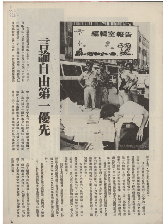
《自由時代》週刊編輯室報告