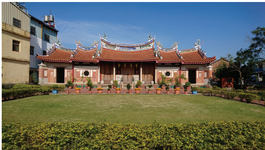
(大肚磺溪書院)